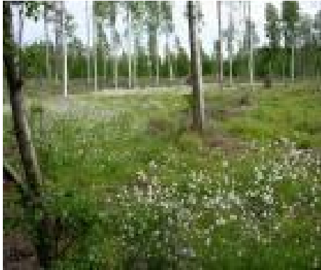
Kuva Härkälän suoalueelta

Suunnittelualan maisemat ovat yleisilmeeltään rauhallisia ja ehjiä, hyvin hoidettuja puustoisten alueiden silhuetit mukaan lukien. Oman arvokkaan lisänsä luontoon ja maisemaan tuo Heiniojan uoma.