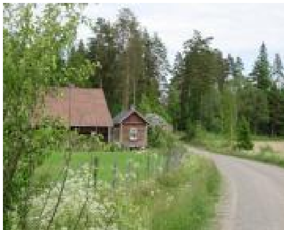
Kuva Härkätieltä Syväojalle

Syväojan niittyjä on käytetty jo 1700-luvulla ja tila on merkitty maarekisteriin v.1840. Syväojan seudun peltoviljelys periytyy 1800-luvun puolivälistä ja peltoja viljellään edelleen. Rakennuskanta on pääosin 1900-luvun alkupuolelta. Tiettävästi 1920-luvulla rakennetun hirsisen asuinrakennuksen laajennusosa on 1970-luvun puolivälistä.