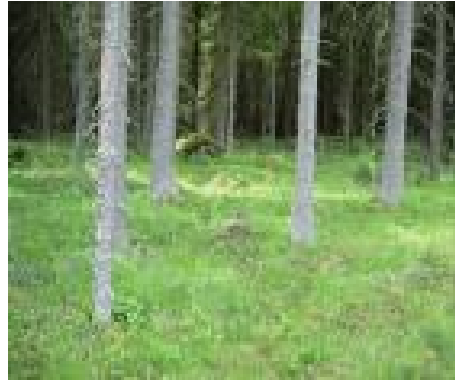
Kuva Hietainmäen alueelta

Alueella ei näy varsinaisia maisemavaurioita. Kissanmäen-Härkälän länsipuolen laajat hakkuualueet avautuvat vasta sisäisessä maisematarkastelussa.