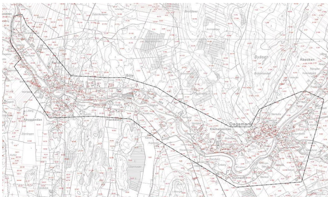
Kuva 2. Suunnittelualueen rajaus.