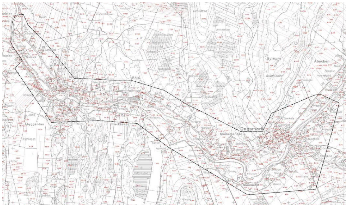
Bild 2. Planläggningsområdets avgränsning.